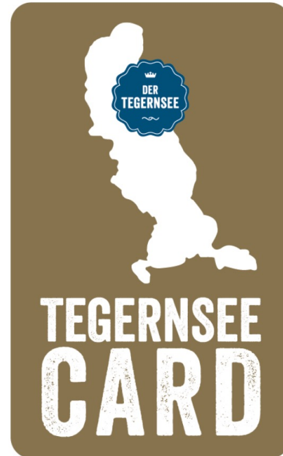
Analoge Druck Papier TegnseeCard